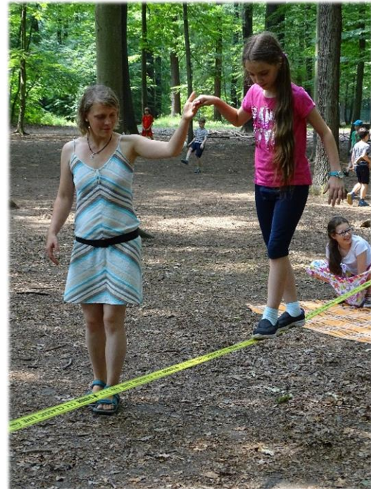
Impressionen vom Kindertag 2018